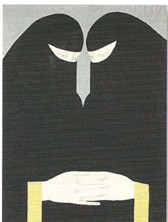
Из серии «Персидские миниатюры»